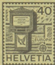
Historischer Briefkasten aus Basel Boîte aux lettres historique de Bâle Buca delle lettere storica di Basilea