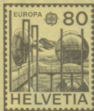
Alpine Relaisstation Jungfrauoch Station relais alpine du Jung- frauoch Ripetitore d'alta montagna dello Jungfrauoch