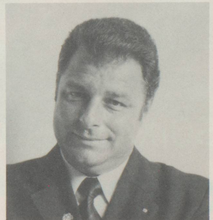
M. J.-P. Delamuraz conseiller national syndic de Lausanne