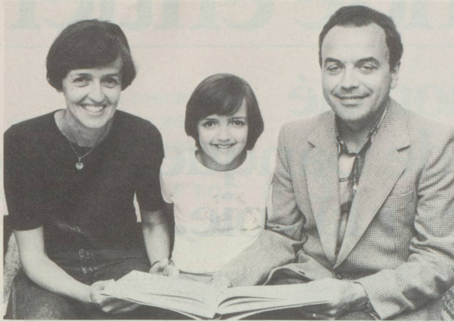
Le professeur et chercheur Werner Arber remporte le prix Nobel en médecine. Ici en compagnie de son épouse et de leur fille.