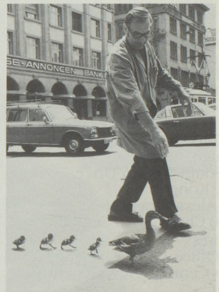
A tous nous souhaitons une «parfaite marche» en 1979 comme cette famille de canards du bord de la Limmat à Zurich.