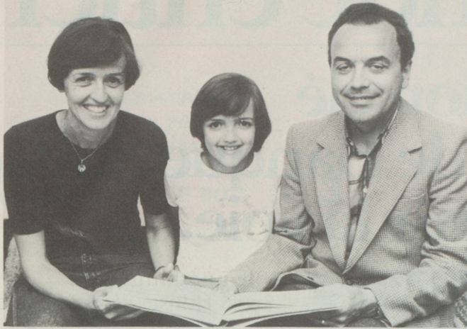
Le professeur et chercheur Werner Arber remporte le prix Nobel en médecine. Ici en compagnie de son épouse et de leur fille.