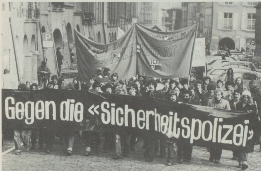
Rejetée par le Souverain, la police fédérale de sécurité n'en a pas moins suscité d'âpres controverses.