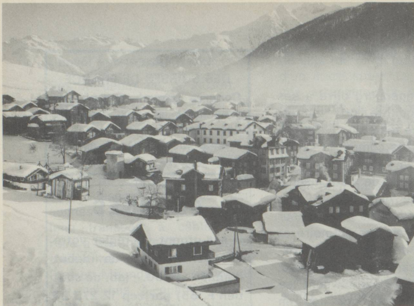
Vue sur le village valaisan de Münster, vallée de Conches/Valais.