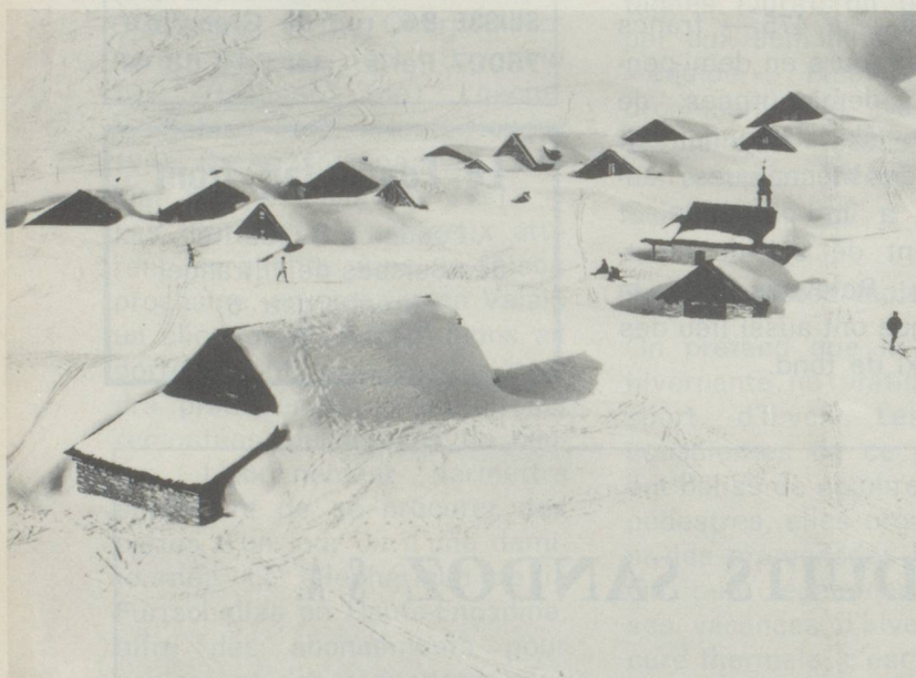
Vue de l'Alpe de Feld depuis le téléphérique Lungern-Schönbüel/Suisse centrale.