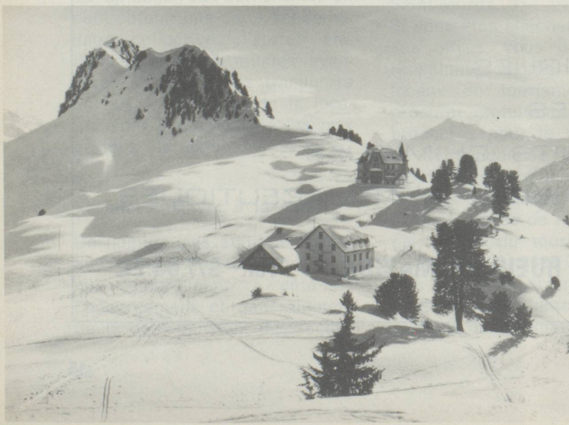
Au-dessus de Riederalp (Valais).