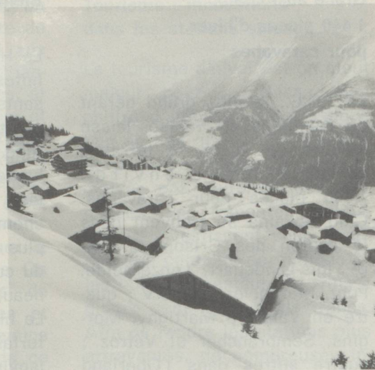
A Bettmeralp au-dessus de la vallée du Rhône, venez découvrir l'agrément et la joie de vacances libérées du bruit et de l'agitation de la vie citadine/Valais.