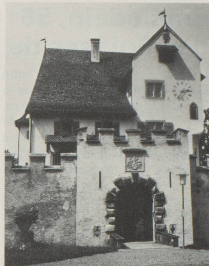
Le petit château de A Pro, à Seedorf

Une attraction très connue à Altdorf est la représentation de l'histoire de Guillaume Tell de Schiller qui a lieu chaque année à la maison des fêtes, alors qu'un récent atelier-théâtre à Altdorf se consacre avec beaucoup de réussite à des œuvres plus modestes. Un groupe culturel s'est penché sur les traditions anciennes et remet à l'honneur la poésie, les contes, fait de la recherche historique, de la philosophie ainsi que met en évidence les us et coutumes de la région qui sont très