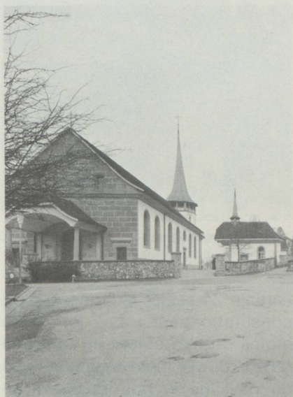
Rénovation de l'ancienne église à Tavel (FR)