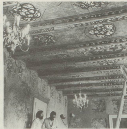
... et après rénovation

Se fondant sur l'article 24 sexies de la constitution adopté par le peuple et les cantons en 1962, la Confédération a promulgué en 1966 la loi sur la protection de la nature et du paysage . La protection fédérale des monuments, qui n'était réglementée jusque-là que par un arrêté fédéral, a reçu par