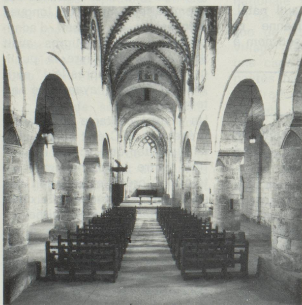
La nef de l'église romane de l'ancien couvent de Romainmôtier date du onzième siècle ; la voûte du treizième a été refaite en style gothique. Des concerts y sont donnés occasionnellement.

Il y a plus de quinze cents ans, saint Romain et quelques compagnons y ont défriché une clairière au cœur de la grande forêt de résineux qui monte à l'assaut des crêtes jurassiennes.