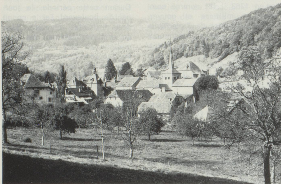
Vue de Romainmôtier et de l'église romane de l'ancien couvent, dédiée aux saints Pierre et Paul. Dans la vallée du Nozon, au pied du Jura vaudois.

Au premier coup d'œil, le visiteur est frappé par la puissance évocatrice des lieux : dans une petite vallée du Jura suisse, celle du Nozon, le temps semble s'être arrêté au Moyen Âge. Un peu plus haut, certes, les trains internationaux passent à toute vitesse dans la gare de Croy-Romainmôtier, sur le tronçon Lausanne-Vallorbe, emportant les voyageurs du Trans-Europ-Express vers la France voisine. Mais Romainmôtier est resté une île de silence.