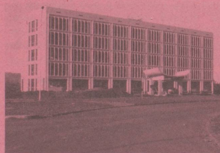
Ambassade de Suisse B.P. 597 KIGALI 21, boulevard de la Révolution Bâtiment de l'Agence Maritime Internationale (AMIRWANDA), 1 er étage, tél. : 5534