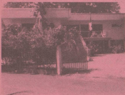
Ambassade de Suisse rue de l'Ecole de Santé B.P. 720 Donka KONACRY II Tél. : 613-87