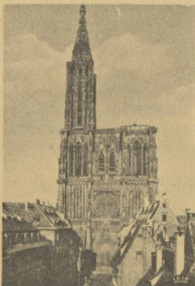
7, rue Schiller Tél. : 35-15-17/18