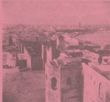
Rabat Ambassade de Suisse Boîte Postale 169 Square Condo-de-Satriano.