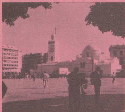
Ambassade , 27 Bld Zirout Youcef, de 9 h à 12 h du dimanche au jeudi, Boîte postale 482, Alger-Gare , Algérie.