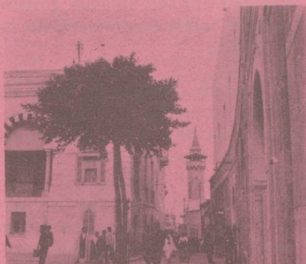
Ambassade de Suisse 17, avenue de France