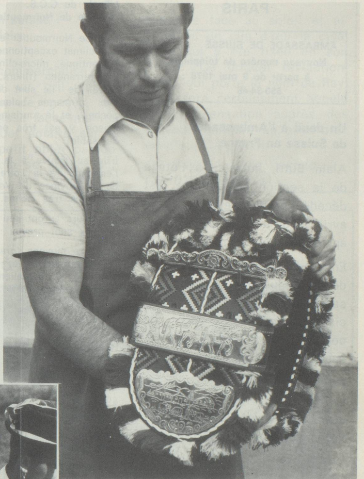
Vingt-cinq heures sont nécessaires pour confectionner un collier avec des broderies de cuir, des touffes de laine et des ornements de laiton scintillants.

confectionnés à la main, pièce par pièce, avec un soin jaloux. Le sellier garnit la large bande de cuir de petites lanières colorées et de nombreux motifs multicolores, puis il l'embellit d'ornements bariolés finement tressés. Enfin, le collier est entièrement bordé de centaines de petites touffes de laine destinées à protéger le pelage de la vache de frictions douloureuses durant la longue montée à l'alpage. On y découvre en outre les fameux ornements de laiton appelés « l'or du paysan ». Plusieurs petits repoussoirs permettent de ciseler et de marteler les plaquettes découpées. Il en résulte le plus souvent des images de vaches de toutes les formes et de toutes les tailles possibles. A l'ai-