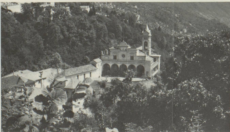
L'église de pèlerinage Madonna del Sasso, Locarno

La Suisse est entrée dans la littérature grâce à ses chants de guerre. Puis, avec la Réforme, les textes à caractère politique se sont multipliés. C'est plus tard seulement que le sentiment de la nature, la beauté des paysages, les idylles se sont introduits dans les lettres avec le mouvement lyrique. A ces écrits contemplatifs vint s'opposer Ulrich Bräker, résolument réaliste, qui décrit les misères des débuts de l'ère industrielle. Y succède un