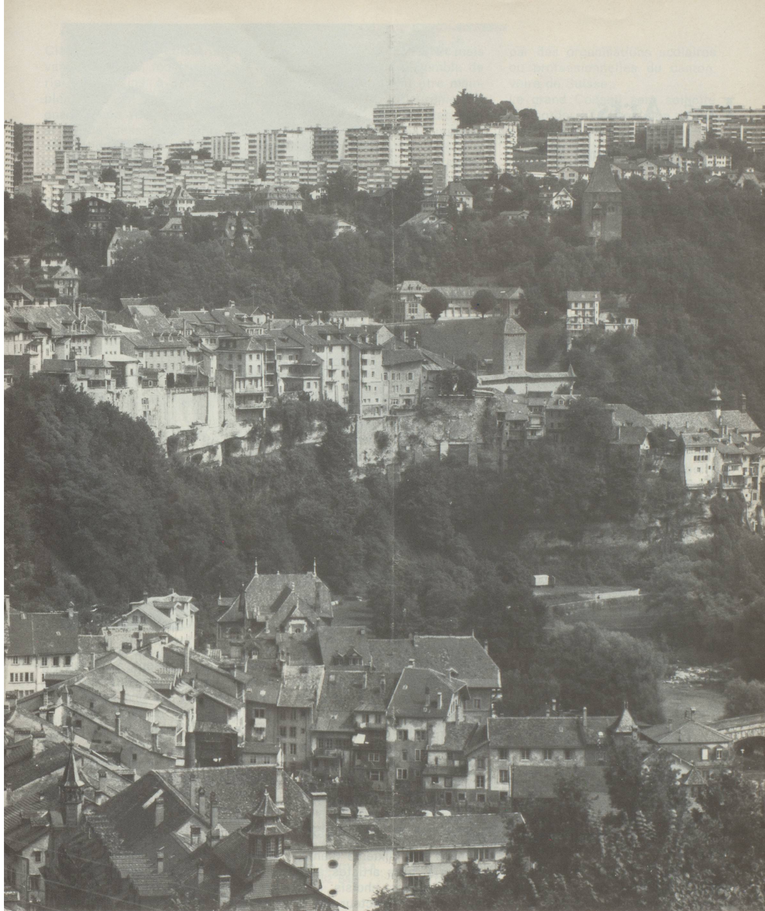
Coexistence de l'ancien et du moderne à Fribourg-ville. Comme dans une estampe japonaise, s'étagent la Neuve-ville, le Bourg et le Stalden, le Schoenberg : trois étages d'une même ville.