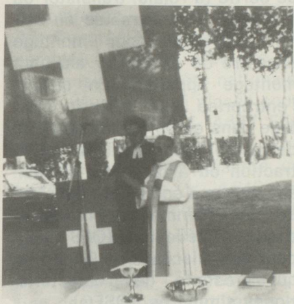
Célébration du culte oecuménique