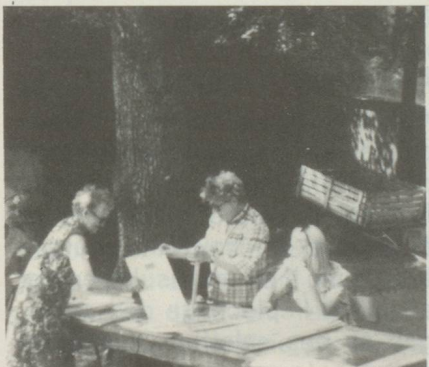
Le stand des Arts