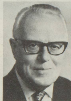
Pierre Graber Département politique fédéral