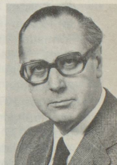
Hans Hürlimann Département fédéral de l'intérieur