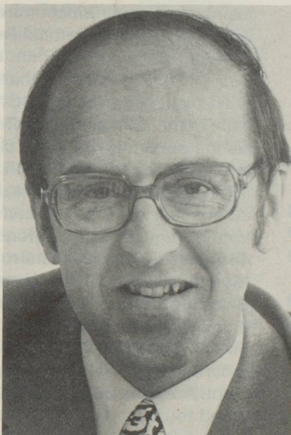
Kurt Furgler Président de la Confédération Département fédéral de justice et police