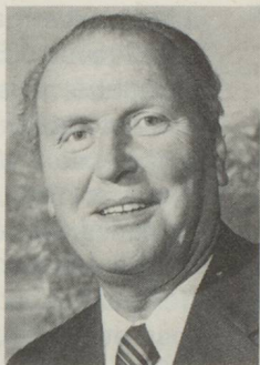
Willy Ritschard Vice-président Département fédéral des transports, des communications et de l'énergie