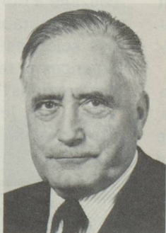
Georges-André Chevallaz Département fédéral des finances et des douanes