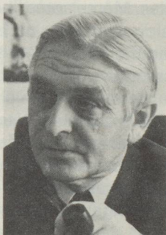
Ernst Brugger Département fédéral de l'économie publique