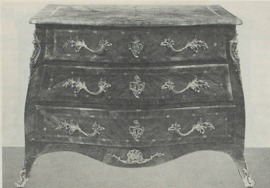
Commode Louis XV, Berne