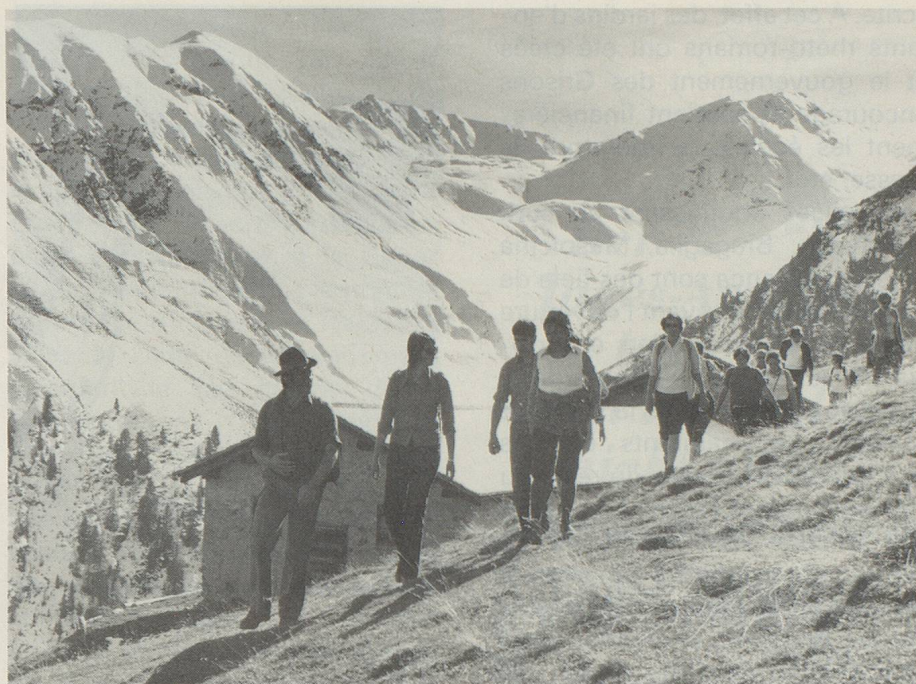
L'alpe de Vaüglia dans le Parc national

Au cours des dernières décennies, l'industrie s'est infiltrée de plus en plus dans certaines régions. Le plus grand complexe industriel des Grisons est constitué par la fabrique de produits chimiques et fibres synthétiques d'Ems (Emser Werke). L'eau est utilisée au maxi-