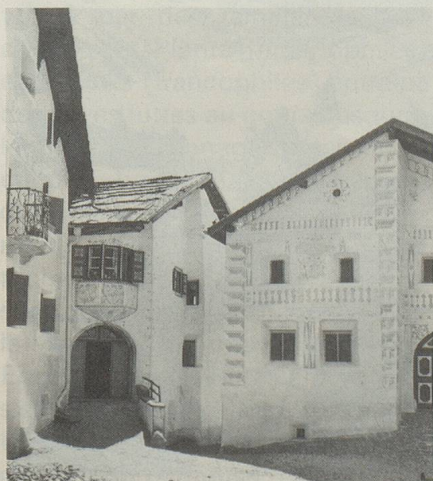
Maisons typiques à Guarda

causée par la situation économique, de nombreux citoyens rhéto-romans depuis le XVII e siècle (tout d'abord à l'étranger puis dans les grandes agglomérations de Suisse alémanique), ainsi que l'arrivée d'éléments parlant d'autres langues et ne cherchant guère à s'adapter, ont nui à la langue rhéto-romane. C'est la raison pour laquelle il est devenu nécessaire de protéger tout spécialement cette belle langue, fille du latin, dont les cinq patois n'ont pas pu être amalgamés en une langue