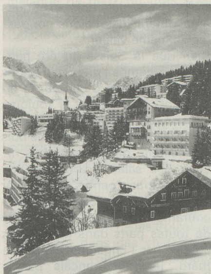
Arosa, l'un des centres sportifs des Grisons