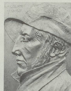
Tête de chasseur

Les Grisons (en langue rhéto-romane: Grischun, en italien: Grigioni, en allemand: Graubün-