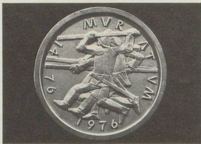
Ecu commémoratif réalisé par le graphiste Kurt Wirth, Berne.

La mort de Berthold V (1218), dernier représentant de la branche ducale, a fortement changé la situation. Les biens propres des Zaehringen ont été transmis à la maison de Kibourg, tandis que les droits impériaux, dont Berne et