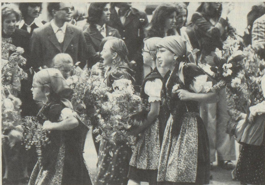
SECHSELAUTEN. — Fête traditionnelle du printemps à Zurich. Le dimanche, cortège des enfants.