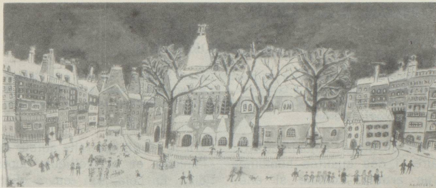
A.-E. Peter — Huiles, gouaches

Pour tout renseignement, s'adresser à son président M. E. Leuba. Téléphone : 033-48-13, 152, boulevard Montparnasse 14°.