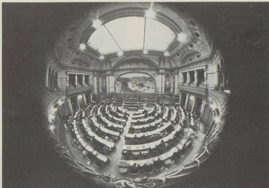
Le Conseil national

● 2 radicaux , le Zurichois Ernst Brugger (entré en 1969) et le Vaudois Georges-André Chevallaz (entré en 1973).