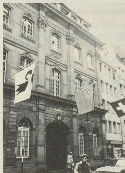
Hôtel de ville de Bâle.

Le lendemain, les membres de diverses commissions sont à nouveau au travail et parlent de droits politiques, d'assurance-maladies, d'information, d'écoles suisses à l'étranger, de droits de nationalité et règlent des problèmes administratifs, tandis que d'heureux Suisses de l'étranger découvrent des merveilles bâloises ou visitent le jardin zoologique.