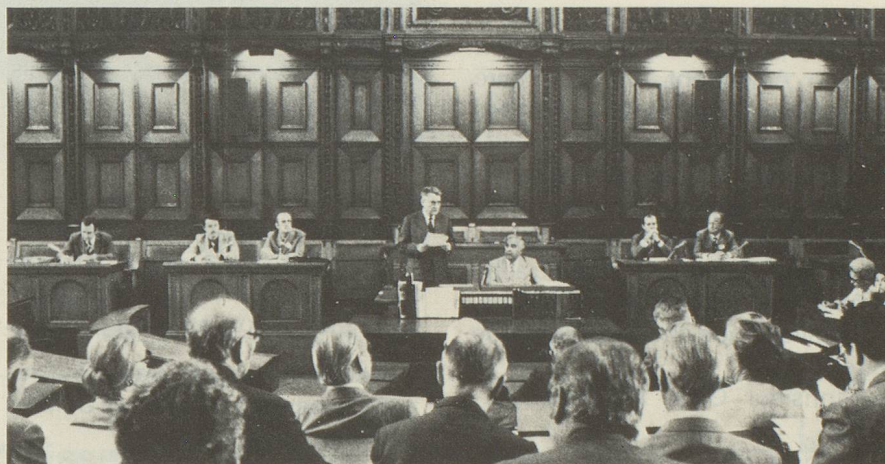
Lors de la séance de la Commission des Suisses de l'étranger.

Ouverture officielle du Congrès – Wildt'sches Haus – cadre magnifique – ambiance très sympathique.