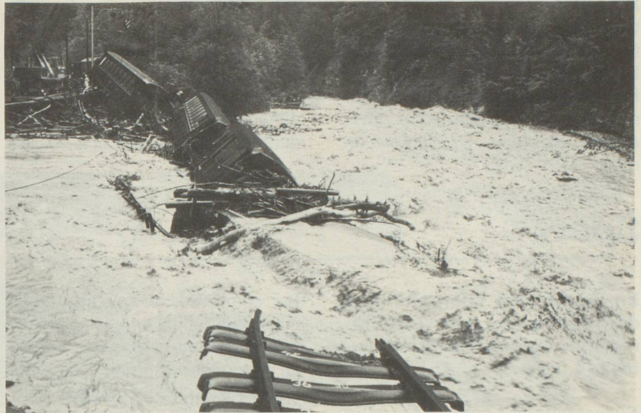
Accident ferroviaire près de Davos.

Le comité d'initiative de Berthoud dépose à Berne son initiative pour