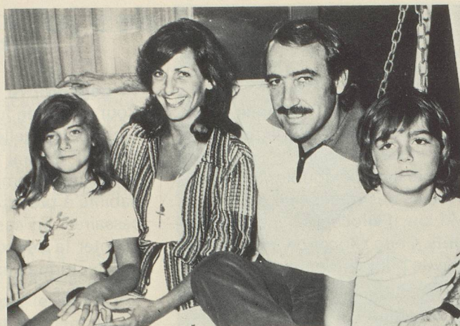
... entouré de sa famille