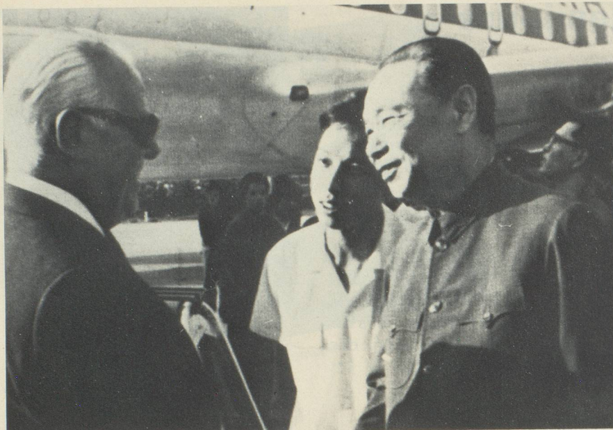
Le Conseiller fédéral Graber accueilli à Pékin par son homologue chinois Tschi Peng Fei.