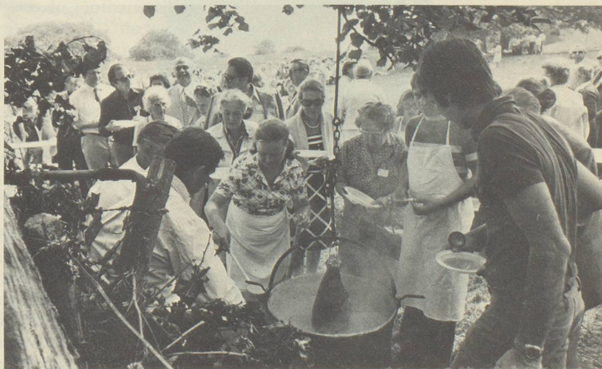
Tous à la «soupe aux pois»