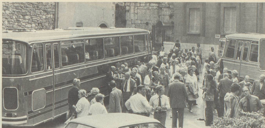
En visitant Neuchâtel