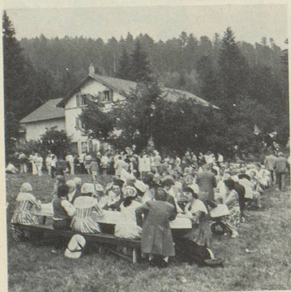
Au cours du pique-nique