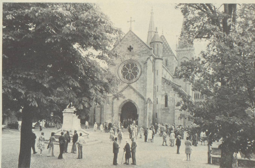
Avant le culte œcuménique