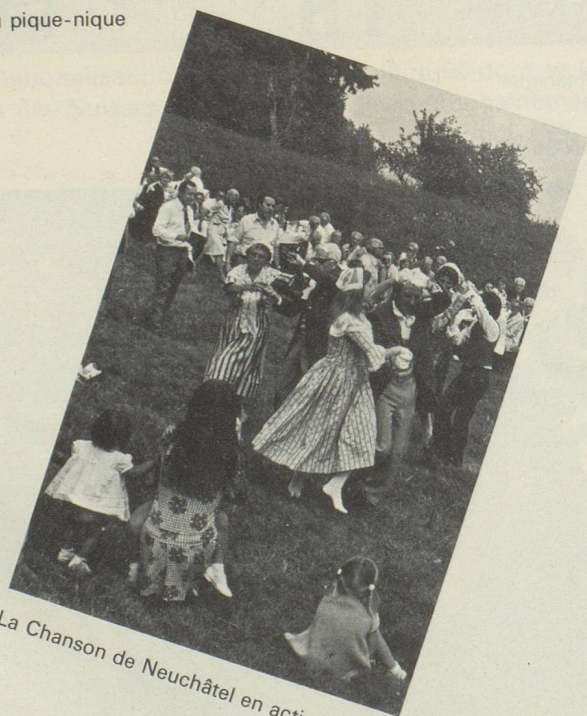
La Chanson de Neuchâtel en action