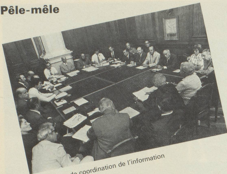
Commission de coordination de l'information