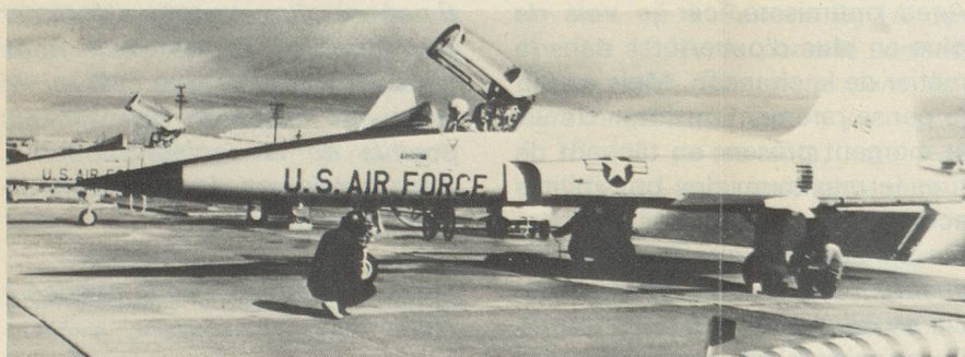
Le F-5E Tiger II.

Un accord de collaboration est signé à Berne entre l'Office suisse d'expansion commerciale et la Chambre pour le commerce et l'industrie d'URSS.