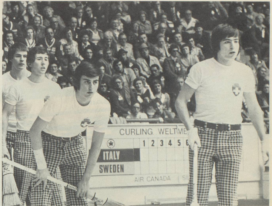
L'équipe du Curling Club Dübendorf gagne la médaille de bronze

La Suisse obtient la médaille de bronze des championnats du monde