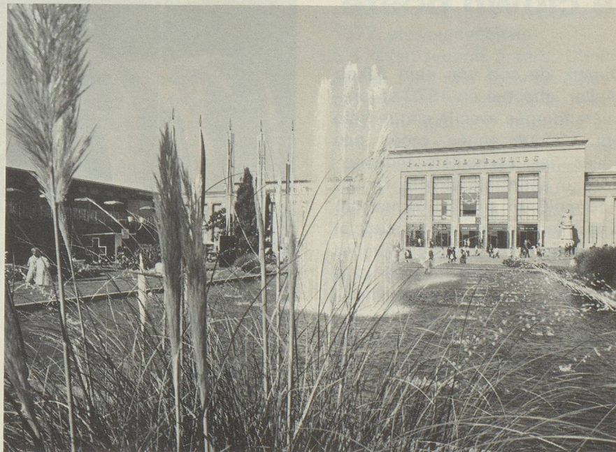
Les jardins du Comptoir suisse de Lausanne.

En football, dans le cadre des préliminaires pour la coupe du monde