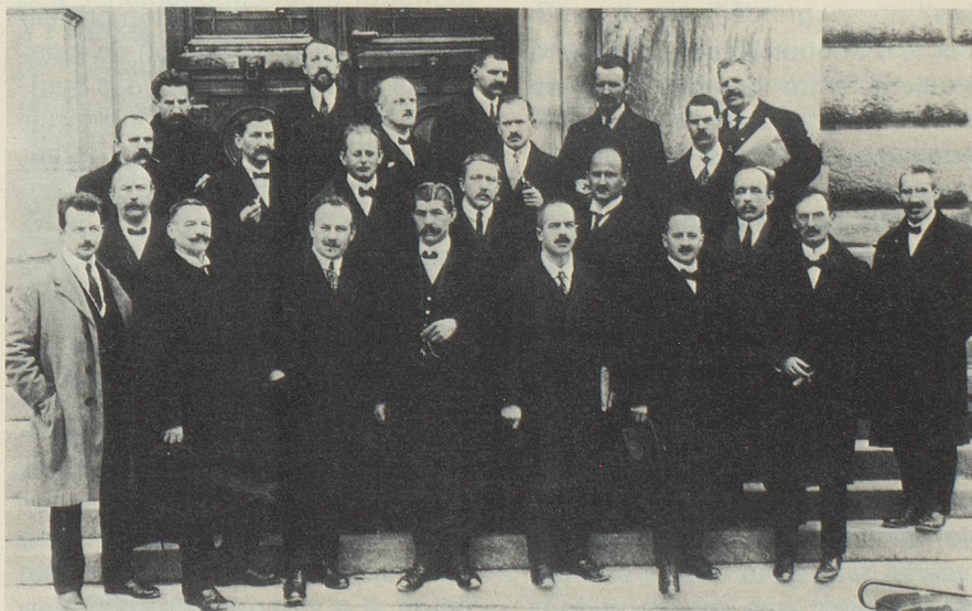
Le comité d'Olten en mars 1919.