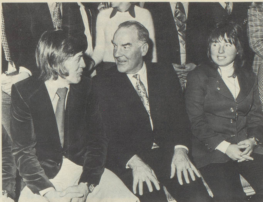
Le conseiller fédéral M. Gnägi a reçu au début décembre nos héros sportifs. On le reconnaît entouré de M.-T. Nadig et de B. Russi.

L'accord de libre-échange avec la CEE est accepté par tous les can-