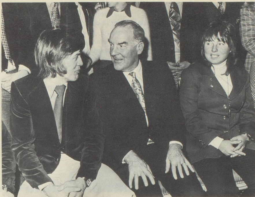
Le conseiller fédéral M. Gnägi a reçu au début décembre nos héros sportifs. On le reconnaît entouré de M.-T. Nadig et de B. Russi.

L'accord de libre-échange avec la CEE est accepté par tous les can-