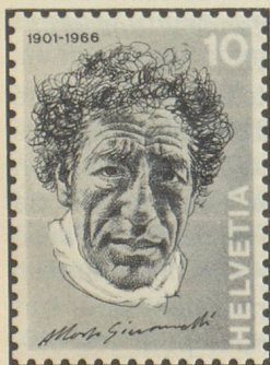
Alberto Giacometti 1901-1966 Peintre et sculpteur