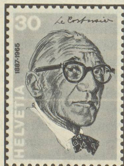
Le Corbusier Ch. Ed. Jeanneret 1887-1965 Architecte et peintre