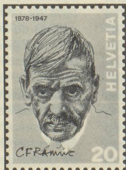
Charles Ferdinand Ramuz 1878-1947 Ecrivain