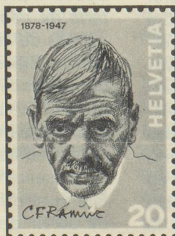
Charles Ferdinand Ramuz 1878-1947 Ecrivain