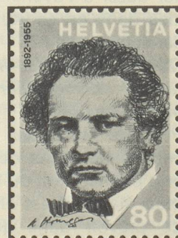
Arthur Honegger 1892-1955 Compositeur