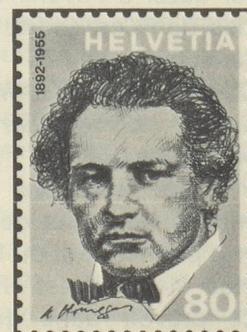
Arthur Honegger 1892-1955 Compositeur