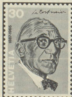
Le Corbusier Ch. Ed. Jeanneret 1887-1965 Architecte et peintre