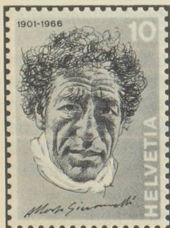
Alberto Giacometti 1901-1966 Peintre et sculpteur