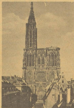
7, rue Schiller. Tél. : 35-15-17/18.

Vous encouragerez le Comité à faire toujours mieux.