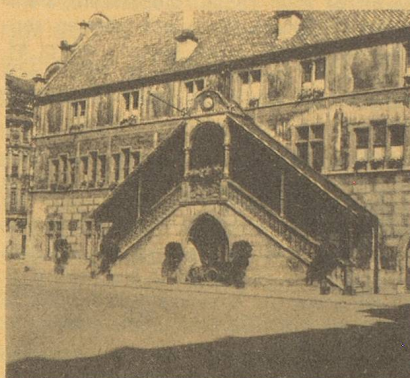
19 a, rue du Sauva Tél. : 45-32-12.