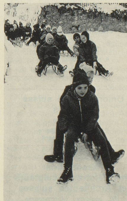
La joyeuse cavalcade finale.

avec leurs maîtres dans une des maisons paternelles pour la collation de quatre heures, où tous se régaleront du « pan grond », qu'accompagnent une tasse de cacao et d'autres friandises, avant d'entonner en chœur de joyeuses chansons du pays. Ensuite commence la partie de luge, où à chaque classe est assigné un des chemins qui mènent à l'école. C'est alors que le jeune cavalier rend son premier hommage à son admiratrice — il arrive qu'il en ait plus d'une — en lui faisant partager sa luge. Les jeunes écoliers de Scuol ne songent pas à abandonner cette ancienne et charmante coutume, qui leur permet de donner libre cours à leurs juvéniles affections.