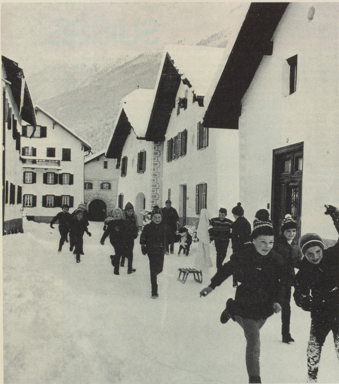
PAN GROND, le Grand pain de poire, à Scuol, en Basse-Engadine (Grisons). Classe par classe, les écoliers de Scuol s'en vont, le jour de la Saint-Etienne, recevoir les « pan grond » de maison en maison. (Reportage ONST).