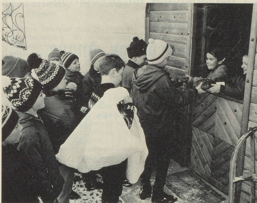
Deux heureux élus reçoivent le pain de l'amitié.