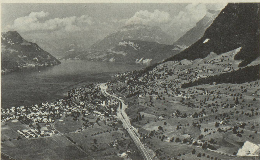
La Nationale 2 actuellement en construction au bord du lac des Quatre-Cantons.