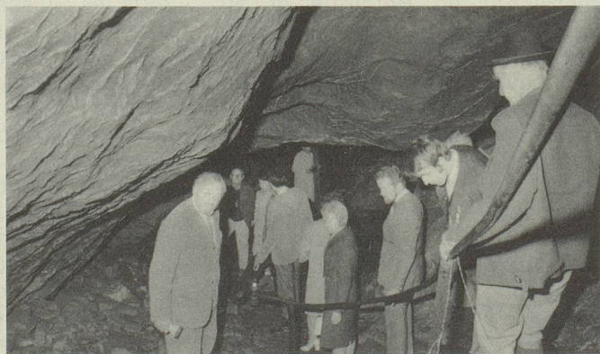
Visite aux grottes de Hölloch du Muotatal.