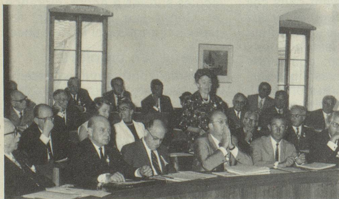
La séance de la Commission des Suisses de l'étranger.