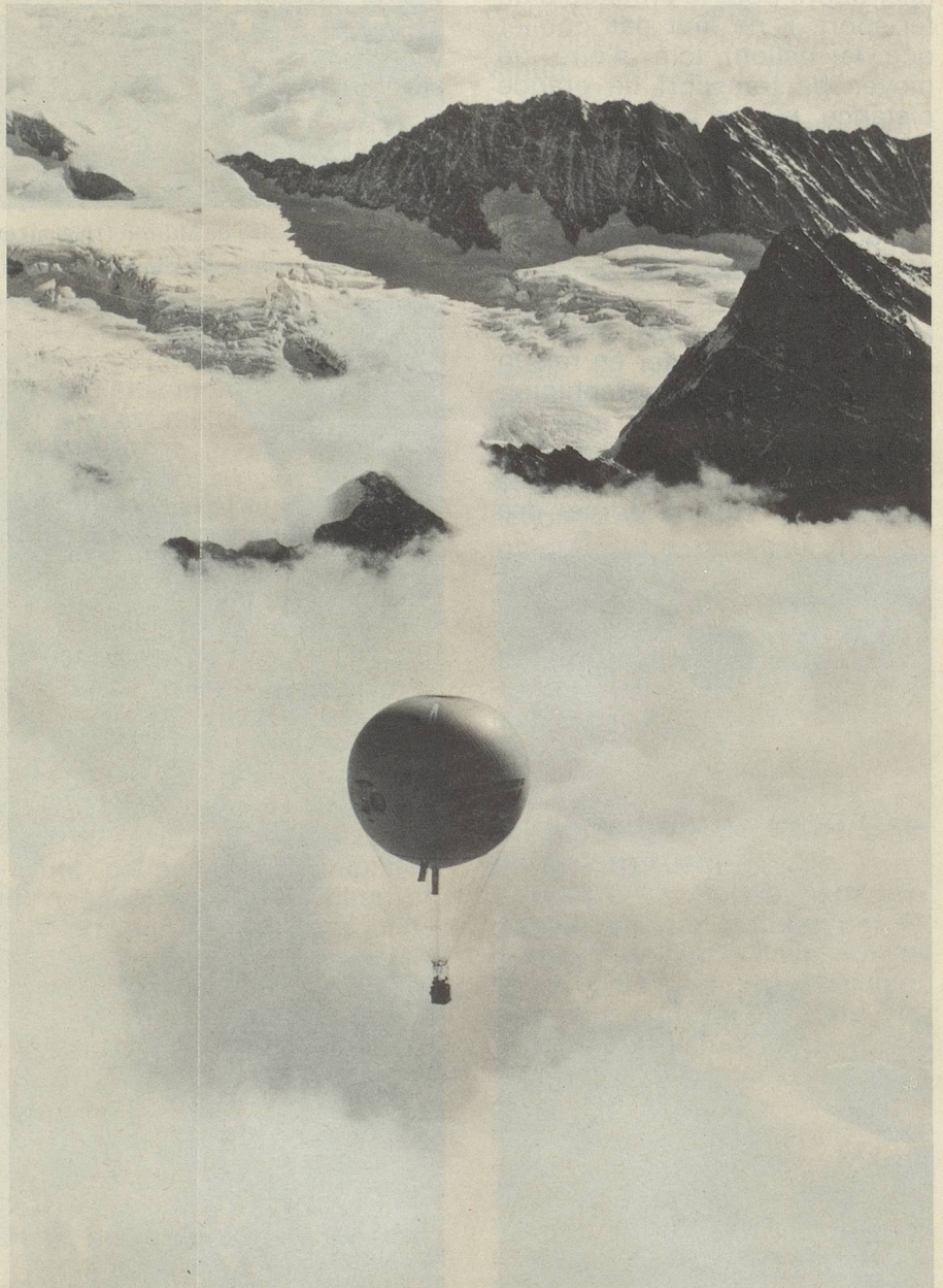
Ballon voguant au-dessus de la mer de brouillard