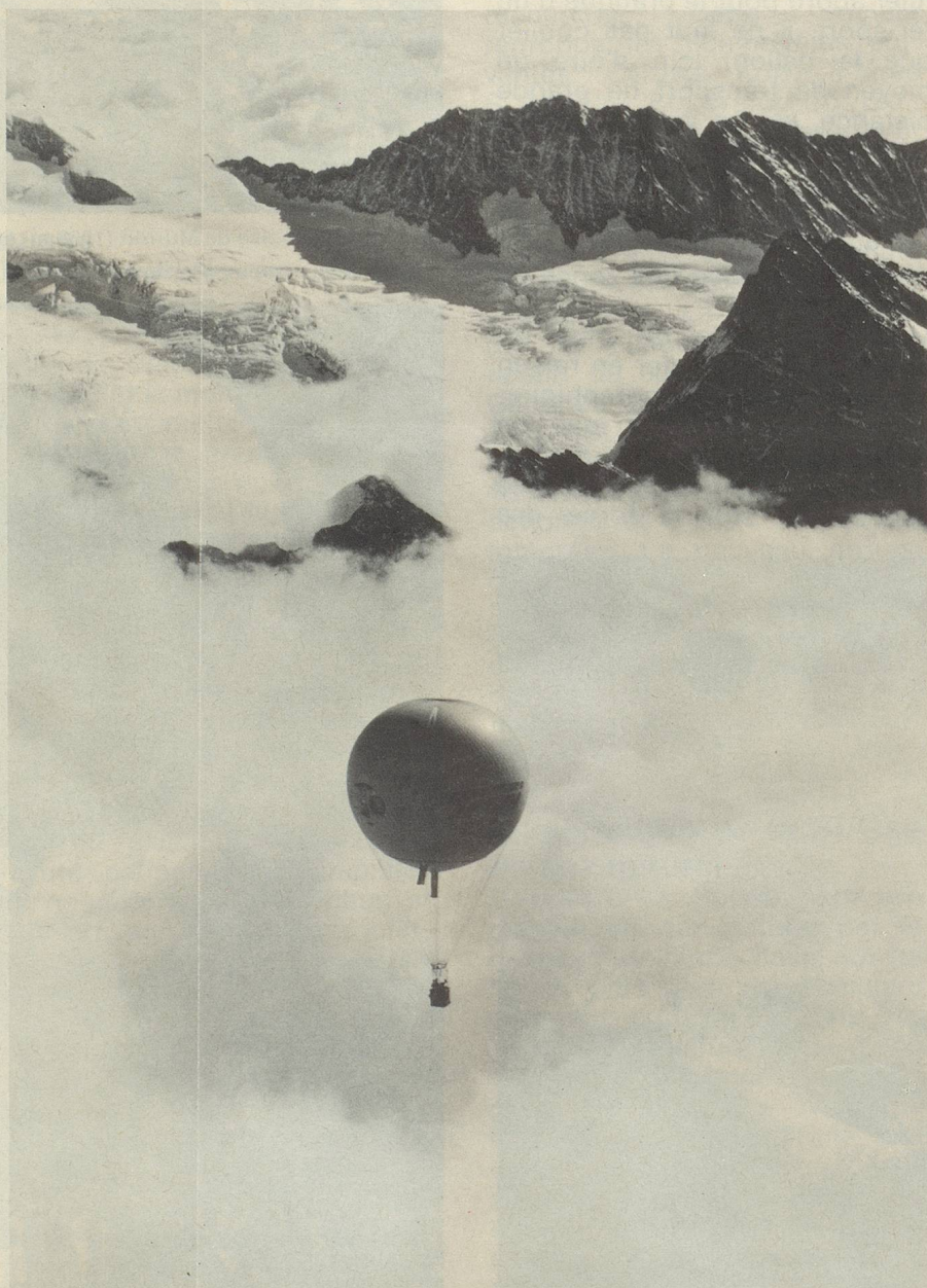
Ballon voguant au-dessus de la mer de brouillard