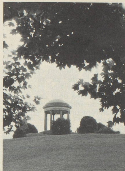
Ce pavillon entouré de verdure est-il le modèle du «Bosquet de Julie» tel qu'il est décrit dans «la Nouvelle Héloïse» de J.-J. Rousseau?

blanc, un éclairage continu au néon et c'est l'admiration, une admiration étonnée, presque envieuse: chacun savait l'Etat de Vaud en difficultés financières et son réseau routier donnait des inquiétudes, de fausses inquiétudes... on serait presque fier d'être Vaudois et de «voir où passe l'argent des impôts»... Mais déjà la lumière du jour apparaît et c'est la fin du tunnel. L'admiration redouble, le souffle coupé, l'on ne sait s'il faut poser son regard sur la gauche, où se profile en amont, sculpture géante, la seconde portée de l'autoroute, ou sur la droite, où le lac immense présente un miroir d'acier. Suspendu entre lac et forêts, l'automobiliste doute un instant des lois de la pesanteur terrestre. Une vision irréelle: presque dérisoire Chillon, le fier et l'imprenable, tassé au pied du viaduc ferme ses murs et ses toits aux regards indiscrets et maintenant trop avertis. L'attention est bientôt attirée par une abondante signalisation routière, flèches de détournement, triangles de prudence, terrassements, encombrements, c'est la fin du voyage et le retour en l'an 1971, étape cruciale de la construction d'un réseau routier prometteur.