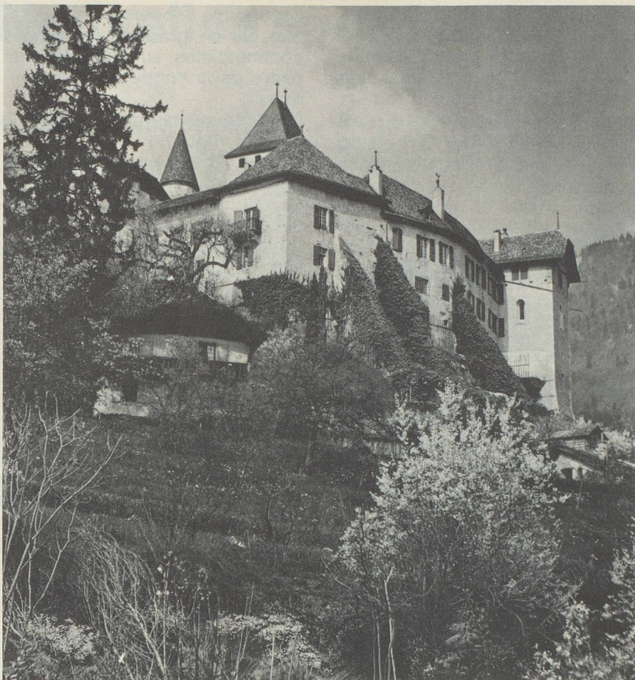
Le nouveau tronçon de l'autoroute est également celui des châteaux historiques. Voici la fière demeure de la famille de Blonay.