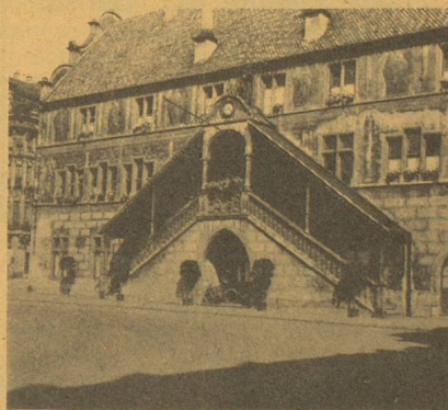
19 a, rue du Sauvay. Tél. : 45-32-12.