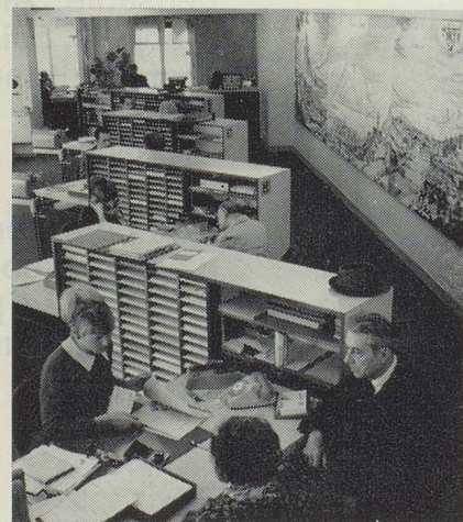
Au premier étage vue des bureaux fonctionnels