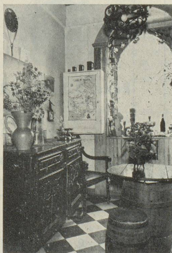
Bureau de réception.

Un nouveau téléphérique a été mis en exploitation le 16 juillet de cette année. La télécabine Sunnegga-Blauherd (capacité 800 personnes à l'heure) parcourt en 8 minutes 1300 m, avec une différence de niveau de 300 m. La deuxième section, le téléphérique Blauherd-Zermatter Rothorn, qui parcourt 9 m. à la seconde, est l'un des plus rapides de Suisse. L'unique skilift des glaciers, sur le Furggsattel, a reçu du renfort, puisque, cet été, on en a installé un deuxième. Les hôtels Rex et Eden annoncent l'ouverture de piscines chauffées. Les traditionnels cours de godille commenceront cette année le 25 novembre et dureront trois semaines.