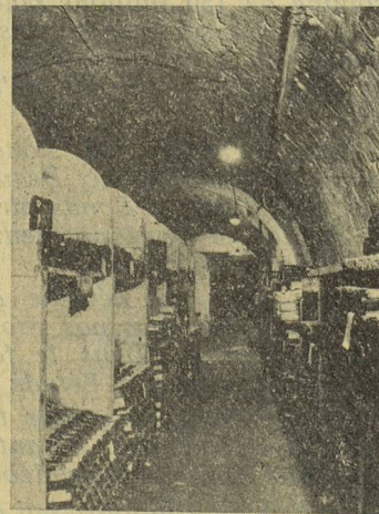
Vue de la cave de vieillissement.