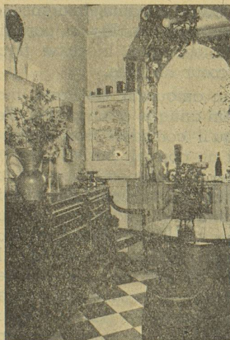
Bureau de réception.

M. Willy Bossard, 166, avenue de Verdun, 97 - Issy-les-Moulineaux (642-91-09).