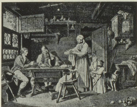
Sigmund Freudenberg, Berne 1745—1801 Hospitalité