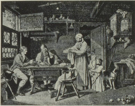
Sigmund Freudenberg, Berne 1745—1801 Hospitalité