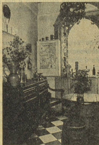
Bureau de réception.

Le Fonds de solidarité est une œuvre d'assistance mutuelle. Par son action de parrainages, elle offre aux privilégiés la possibilité de payer une sorte de tribut à la chance, et à chacun de mettre dans la corbeille du marié ou de la mariée, dans la hotte du Père Noël, ou de marquer le jour anniversaire, d'un cadeau aussi original que précieux.