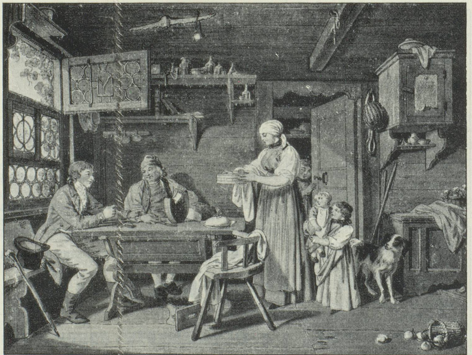
Sigmund Freudenberger, Bern, 1745—1801

Kolorierter Stich, Kunstmuseum Basel Gravure en couleur, Musée des Beaux-Arts à Bâle Coloured Engraving, Museum of Arts in Bas-