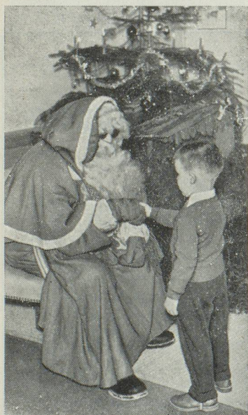
Le Père Noël au « Home »