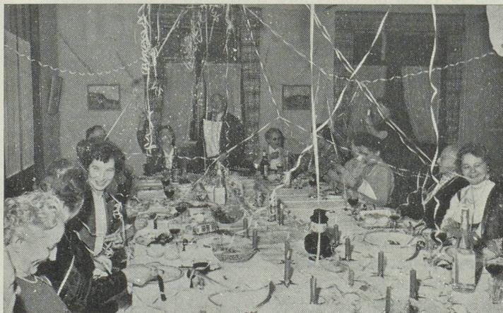
La fête de Sylvestre dans la chaude ambiance familiale du « Home »

«Home» pour Suisses de l'étranger ... un pied-à-terre dans la patrie