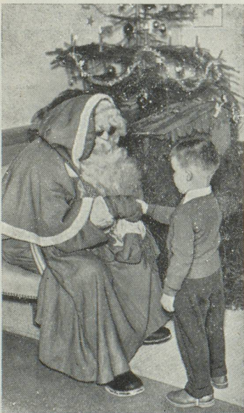
◀ Le Père Noël au « Home »