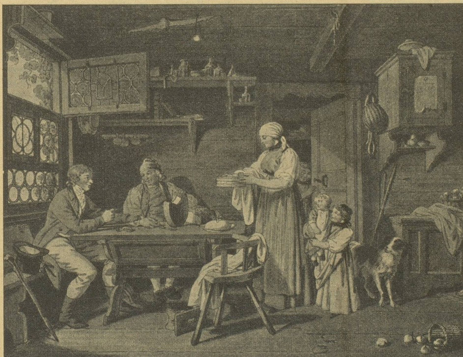
Sigmund Freudenberger, Bern, 1745-1801