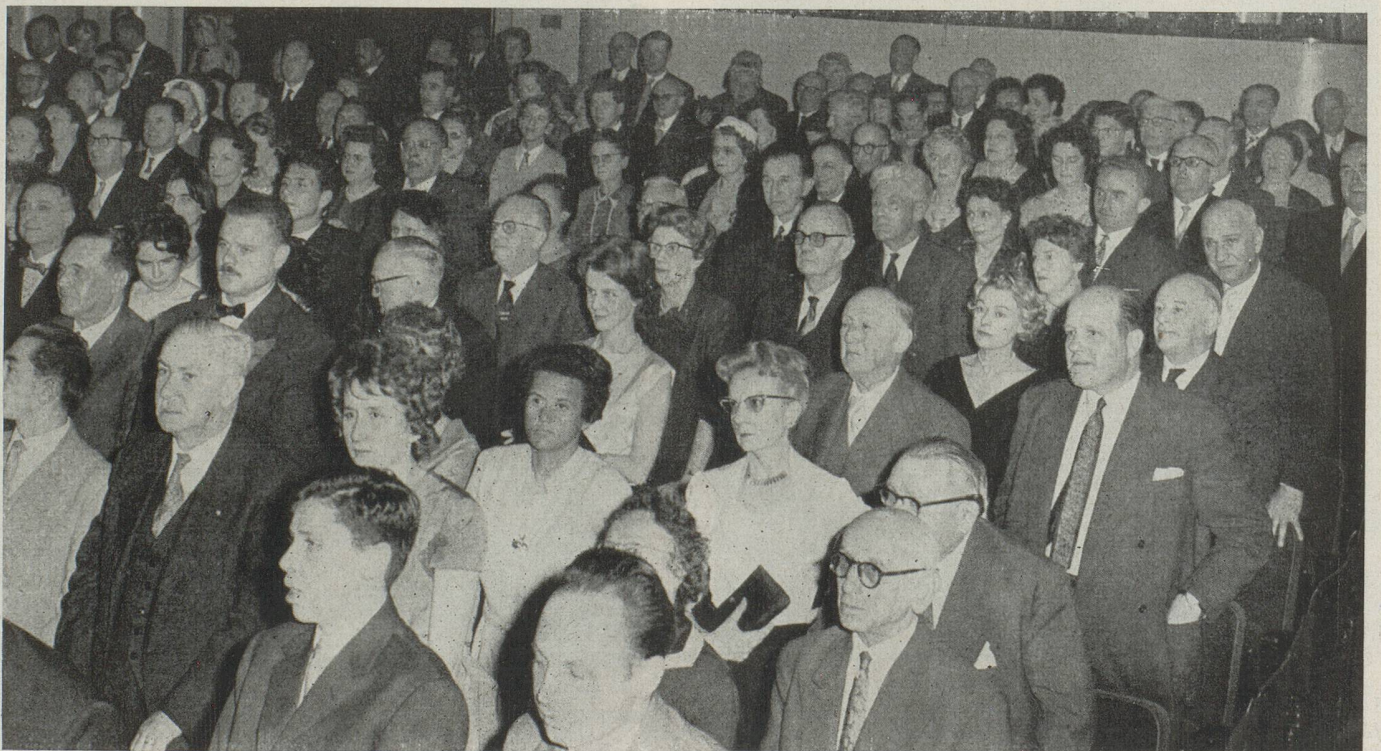
La salle est toujours grave lorsque retentissent les hymnes nationaux suisse et français.