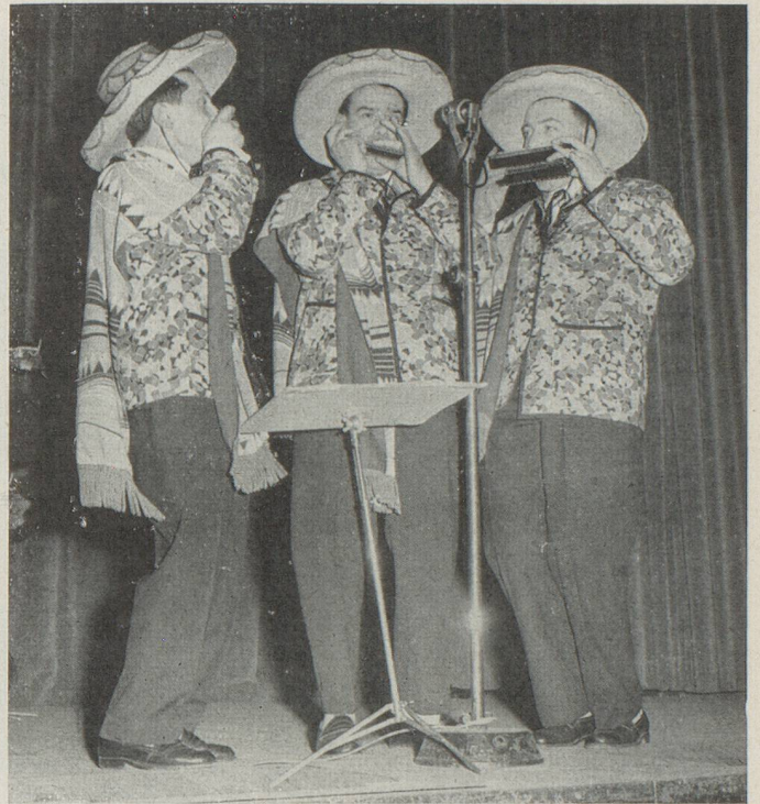
Les Boréals, harmonicistes, furent, eux aussi, chaleureusement applaudis.