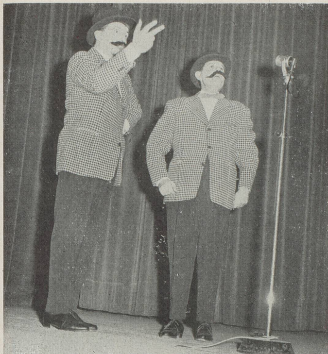
Les Sonys, merveilleux bruiteurs de la R.T.F., enthousiasmèrent les spectateurs.