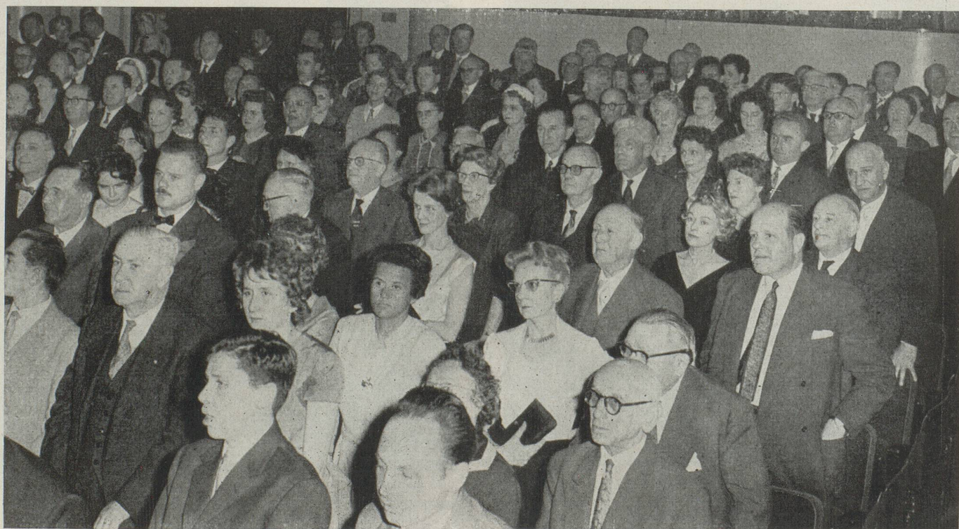
La salle est toujours grave lorsque retentissent les hymnes nationaux suisse et français.