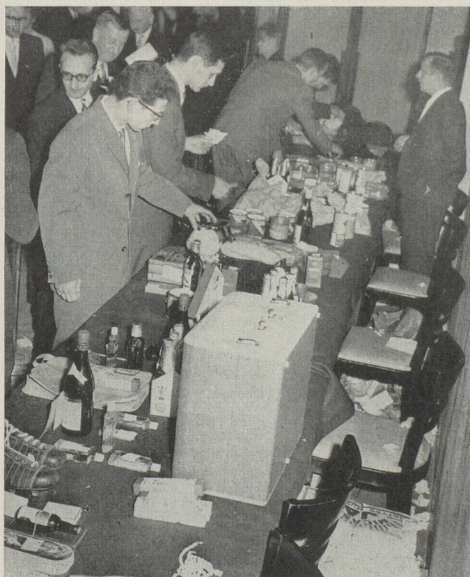
La tombola connut un grand succès. Il y a lieu de féliciter et de remercier les généreux donateurs qui rehaussèrent indirectement l'éclat de cette belle soirée.