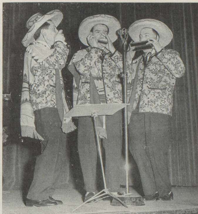
Les Boréals, harmonicistes, furent, eux aussi, chaleureusement applaudis.