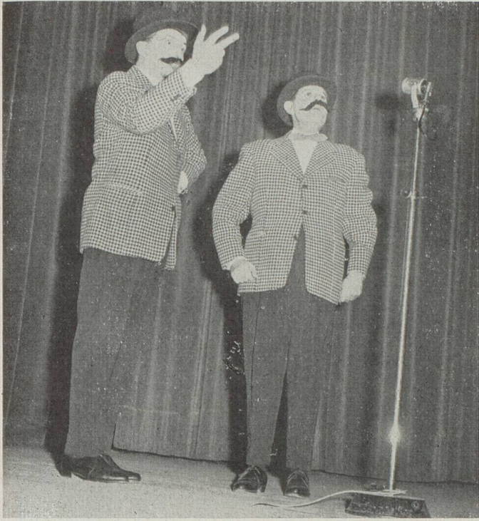
Les Sonys, merveilleux bruiteurs de la R.T.F., enthousiasmèrent les spectateurs.