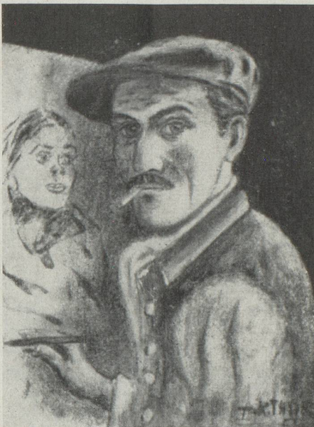
A.-R. THUR peint par lui-même

Notre compatriote, suivant sa vocation, a étudié à l'Académie des