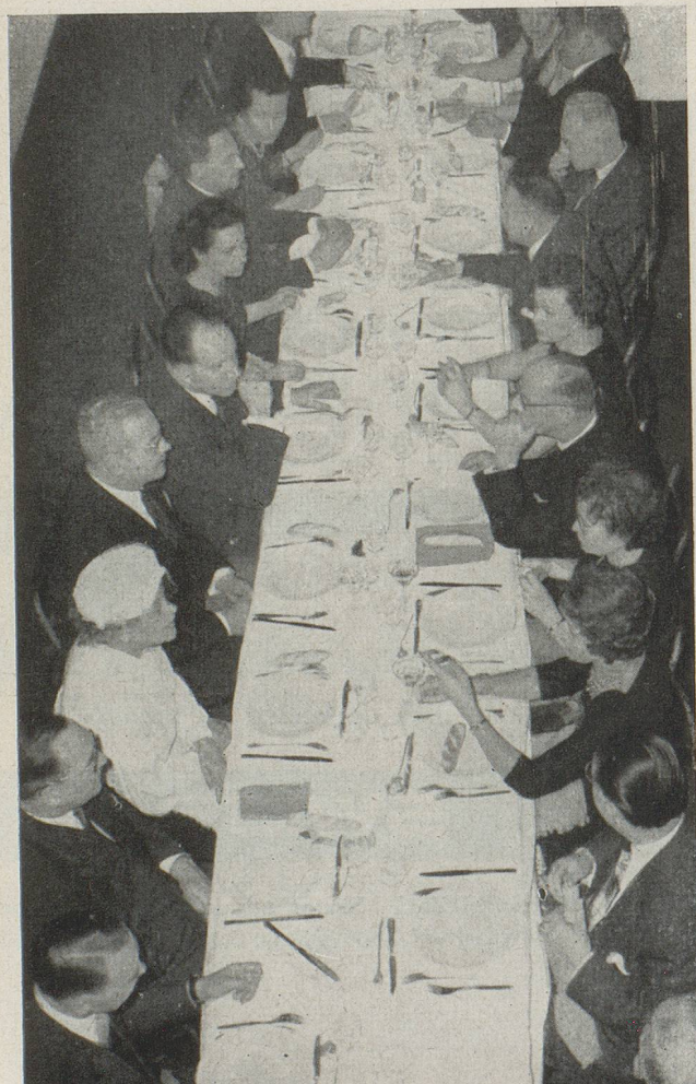
Table de gauche

C E R C L E C O M M E R C I A L S U I S S E