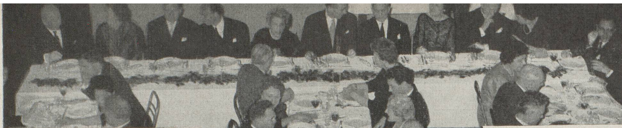
Table du milieu