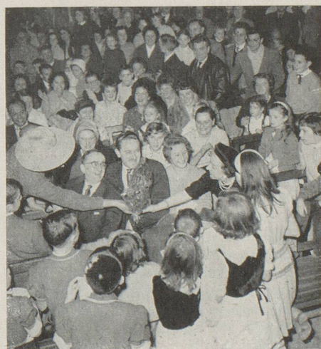
Toulouse : le 20 décembre.