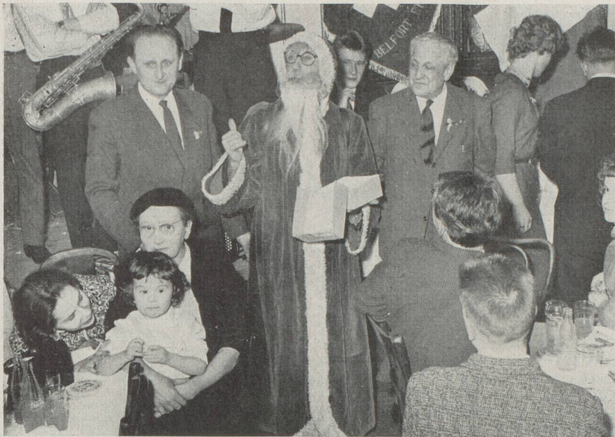
L'arrivée du Père Noël fut accueillie avec joie par petits et grands.

la fête, très animée avec la vente de billets de tombola, qui permit aux « chanceux » d'emporter de jolis lots, et enfin la vente aux enchères d'un superbe objet et d'un imposant cigare comme on en trouve uniquement chez nos voisins suisses.